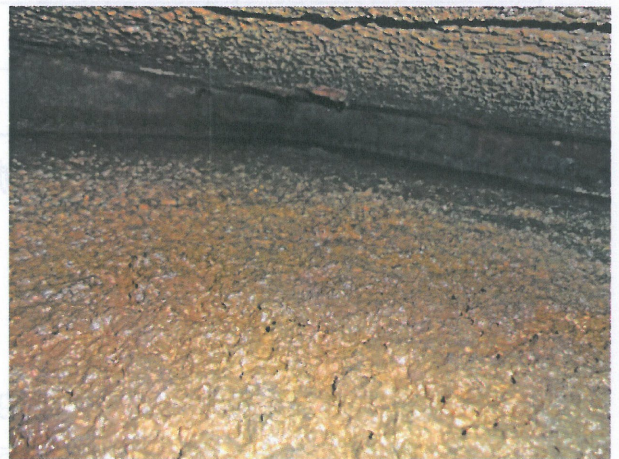
照片 4：化糞池內部情形。