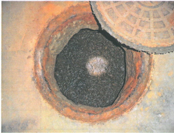
照片 1：化糞池開孔糞塊堆積情形。