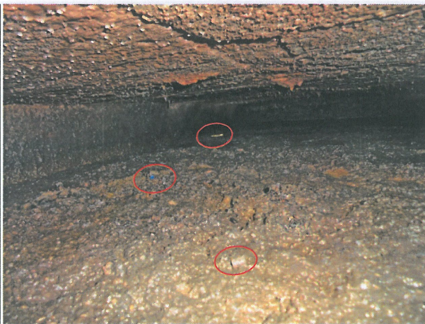
照片 3：化糞池內部垃圾情形。