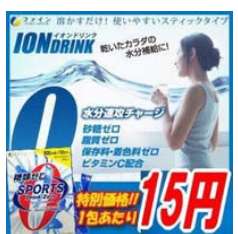
è¨¨ã,ã,Š æiçã@%o ã,'ãfãf